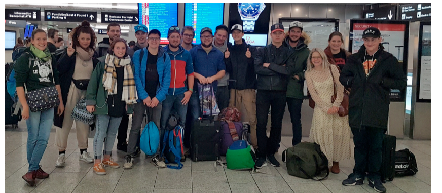
Text und Bilder: Pfrn. Olivia Raval

Entsprechend war unser letzter Abend eher ruhig, bevor wir am Sonntag rechtzeitig und ganz stressfrei unsere Heimreise antraten.